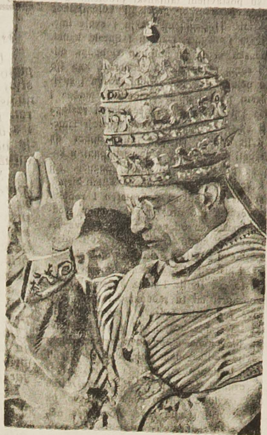
Papa Pio XII. nakon krunisanja daje blagoslov

nicu u krugu koji mu je po krvnom srodstvu ili po tazbini blizu. Crkva je u svojoj velikoj mudrosti zabranila ženidbu među ovako bliskim osobama; a isto je tako zabranjuju i državni zakoni svijeta i svih vremena.