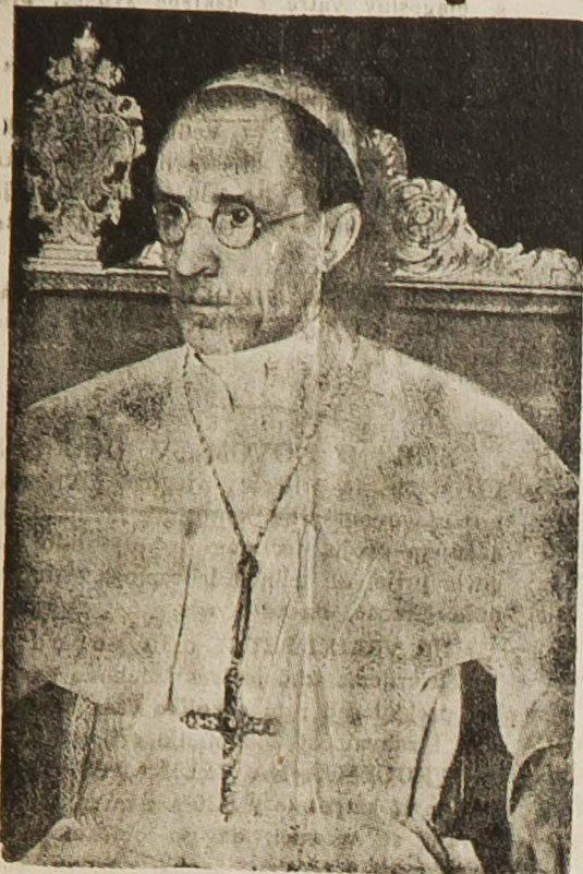
Papa Pio XII.