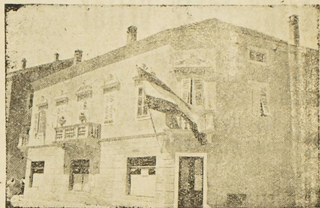
Pogled na kavanu i restauraciju „Šumadija“.

Otvor kavane i restauracije „Šumadija“ Prošlih dana bila je ovdje na svečani način otvorena ova nova kavana i restauracija.