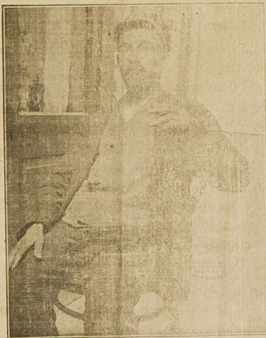
Ministar za cukonitu kroniku. Arnerija Manjinjorgo de Zuccheru.