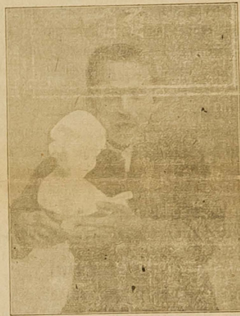
Drugi ajutant Ministra za agrarnu reformu. Verzi Mare otvori