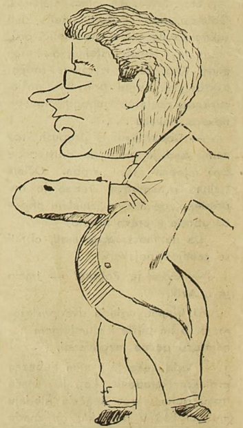
Sa oprecre »SYLVA«

Ako želite bombone, pu-njene sa kiselim kupusom.