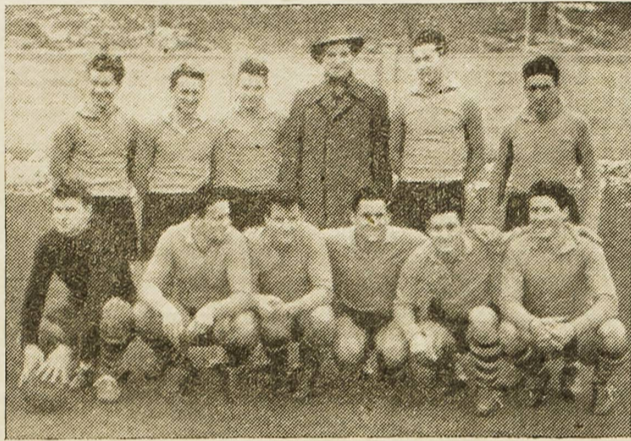
Momčad NK Šibenik