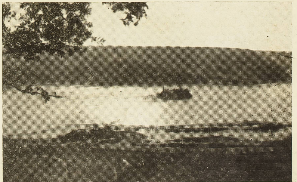
POGLED NA VISOVAC