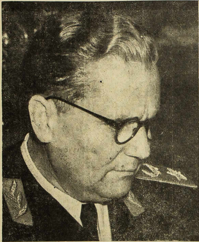
Generalni sekretar Saveza komunista Jugoslavije drug Tito