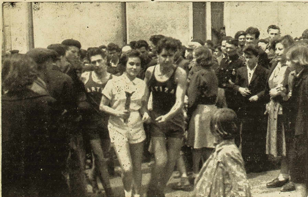
Sa dočeka štafete naroda Hrvatske