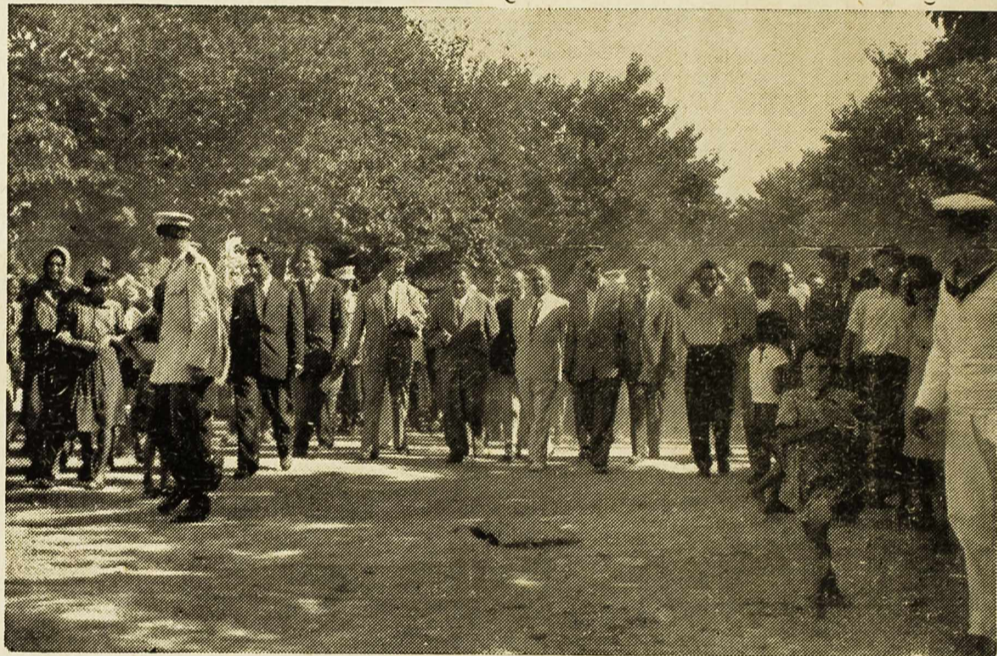
Sa prošlogodišnjeg posjeta druga Tita Zatonu