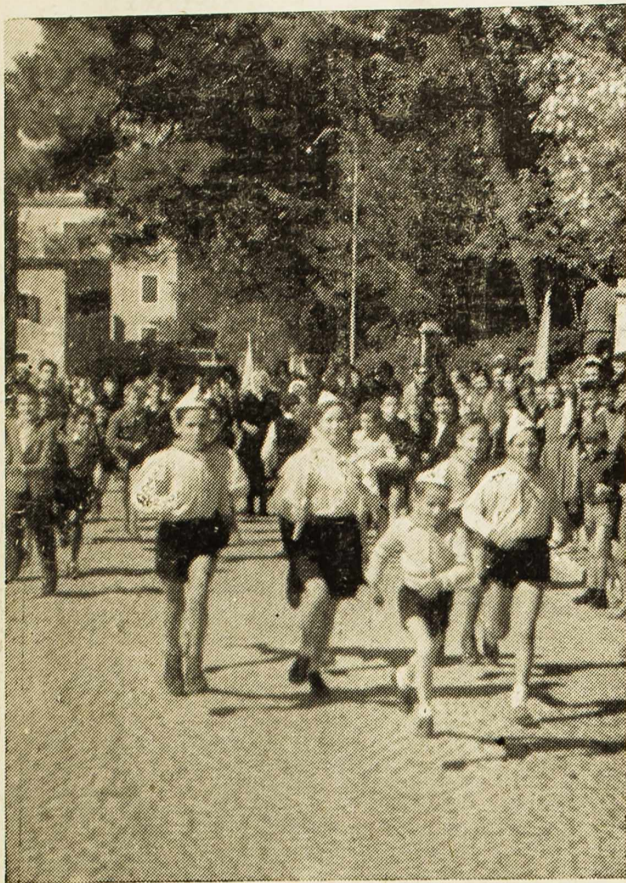
I naši najmlađi nose pozdrave svome Titu