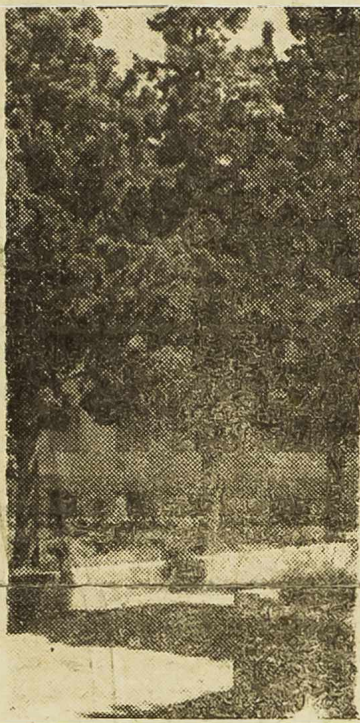
Šibenik — Bolnica

U bivšoj Jugoslaviji nije bilo dječjeg odjeljenja u šibenskoj bolnici, već sam ga ja osnovao 1945. godine na inicijativu i uz pomoć tadašnjeg NOO-a Šibenik. U ovih deset godina nakon oslobođenja prošlo je kroz ovaj odjel oko 9000 bolesne djece, u starosti do 14. godine. U tom razdoblju broj djece je iz godine u godinu stalno rastao. Dok se 1945. na liječenju nalazilo 456, a 1946.