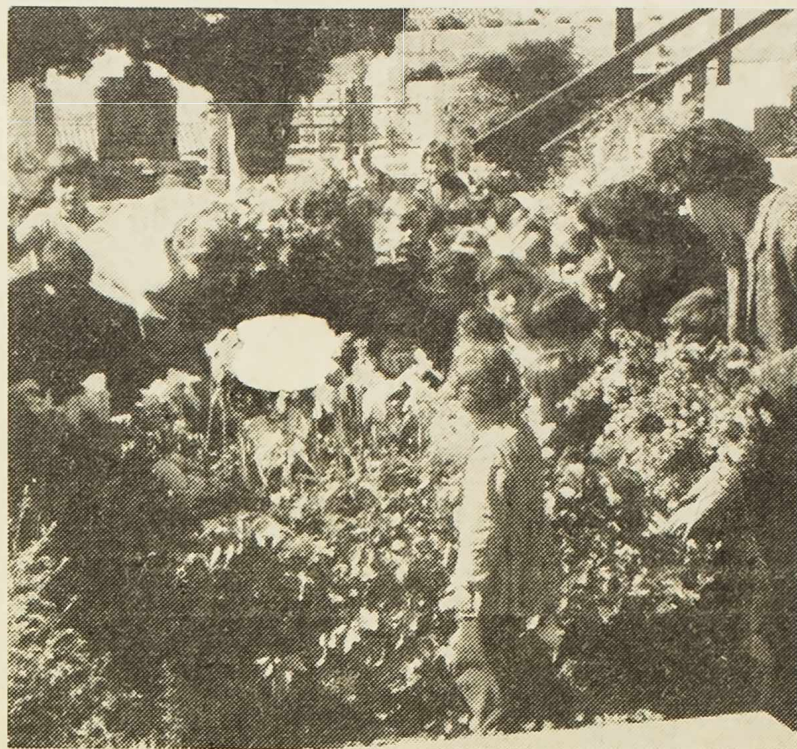
Jedanaestog ovog mjeseca na godišnjicu pogibije Jelke Bučić, djeca iz vrtića, koji nosi naziv »Jelka Bučić« posjetili su njen grob i okitili ga cvijećem.

kadra. U ovoj godini investirat će se u trgovini 21 milijuna dinara. Teško je vjerovati da će se to moći u potpunosti ostvariti s obzirom na nedovoljna sredstva, kojima raspolažu privredne organizacije. Drug Kuhač je posebno istakao da će se u buduću za unapređenje trgovina veća pažnja pokloniti u dodjeli sredstava općinama. U tom smislu bit će daleko povoljniji i novi instrumenti o raspodjeli sredstava. Što se tiče pitanja kadrova možda ne bi bilo na odmet razmotriti mogućnost otvaranja više ekonomske škole na ovom području, u koliko za to budu postojale realne mogućnosti, sredstva i kadrovi. Rudolf Papist govorio je, između ostalog, o pristupanju modernijeg načina trgovanja u Šibeniku i selima, kao što je to već učinjeno u nekim kotarima na području Slavonije. To se posebno odnosi na poboljšanje uvjeta u radu trgovačke mreže na selu, gdje su donedavne zadruge prodavaonice prešle u opće društveni sektor. On je preporučio da se slično poduzme i na našem kotaru, da bi se napredak u trgovini, kakav je u gradu, osjetio i na selu. U daljem izlaganju drug Papist se osvrnuo na kadrovo pitanje, pa je rekao da je zaista teško razumjeti, a još manje opravdati činjenično stanje. Istakao je da fondovi privrednih organizacija trebaju postati izvorima za investiranje u trgovini.