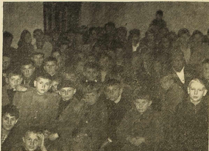
Sibenska Tribina mladih koja je do sada imala 53 nastupa s oko 8.600 posjetilaca, počela je razvijati aktivnost i u susjednim selima

Na slici: Posjetioци kino-predstave u Raslini, koju je organizirala Tribina mladih.