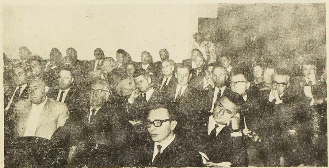
Sa skupa otorinolaringologa

ravka u Šibeniku, naši gosti su posjetili zdravstvene ustanove i neke objekte naše socijalističke izgradnje. Razgledali su i kulturno-historijske spomenike, a na kraju su posjetili slapove Krke.