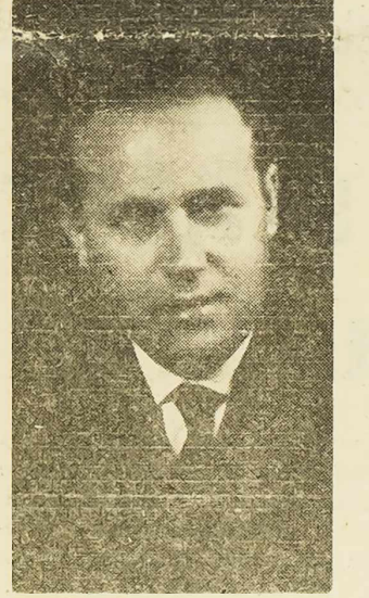
U kolikoj mjeri i na koji način sindikalne organizacije doprinose unapređenju proizvodnje i produktivnosti rada?

Na pitanje da nam kaže koji su najvažniji zadaci sindikalnih organizacija na području šibenske komune u periodu održavanja godišnjih skupština, drug Bujasa je rekao: — Godišnje skupštine sindikalnih organizacija u radnim organizacijama koje se sada održavaju, i na kojima će se govoriti o rezultatima i slabostima u radu, posebno treba da istaknu najvažnije zadatke koji stoje pred njima u budućem radu.