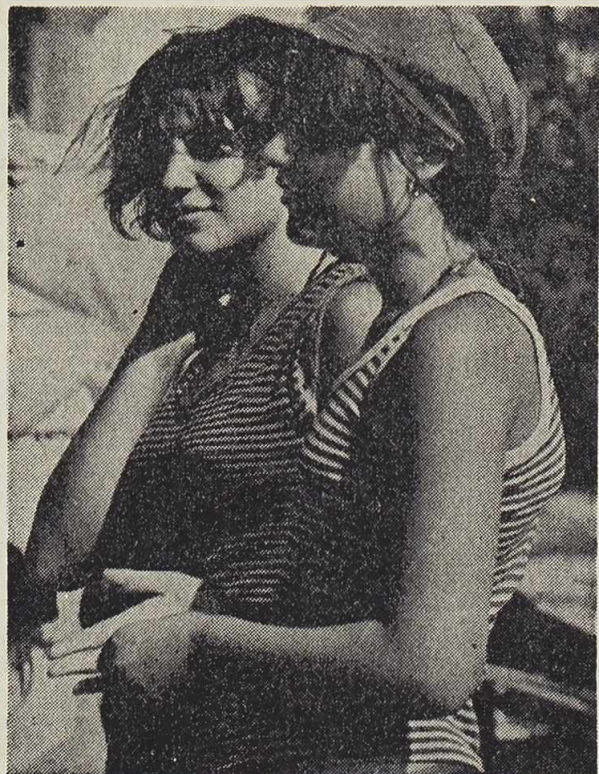
Djevojke iz Grebaštica