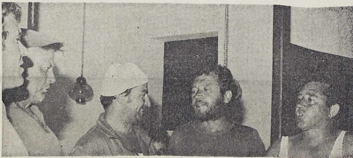
Ribari s Kalija na Kornatima

Kako pobjeći zahuktaloj »industriji turizma« koje smo svjedoci i ovog vrelog kolovoza? Kako u tipiziranom sustavu ponude pronaći nešto što će nas održati u osjećaju djevičanskih ljepota, nezaboravnih ugodaja, nekonvencionalnih susreta.