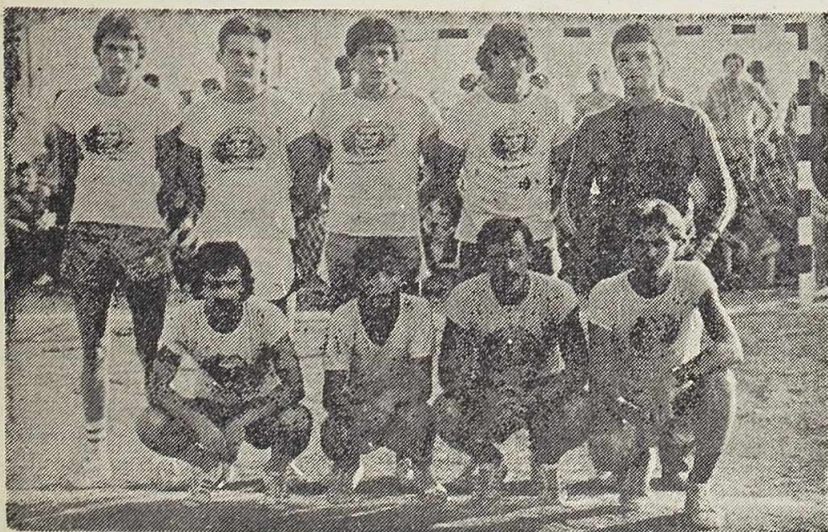
NK »Mandalina« — najbolja među dvadeset momčadi