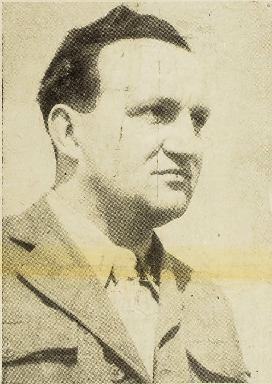
Predsjednik Narodne vlade Hrvatske Dr. Vladimir Bakarić, tajnik Jedinštvene narodnooslobodilačke fronte Hrvatske

Kada su predstavnici naroda: članovi Predsjedništva i vijećnici ZAVNOH-a i ostali odličnici na čelu sa sijedim narodnim borcem Vladimirom Nazorom, predsjednikom ZAVNOH-a, polazili na izvanrednu sjednicu Predsjedništva